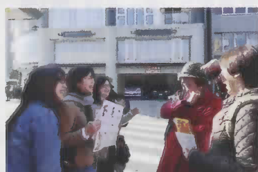
▶ 宮島口で外国人に英語ガイドを呼びかける