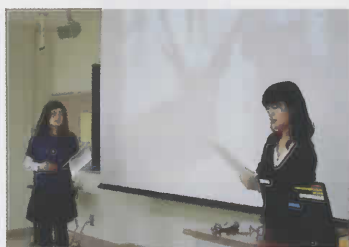
◀ 1月8日のバーチャル英語ガイド

11月に実施した実践編(宮島でのガイド)では、アメリカ、イギリス、スコットランド、オランダ、スウェーデン、チェコ、ギリシャなどから訪れた外国人観光客を案内しました。