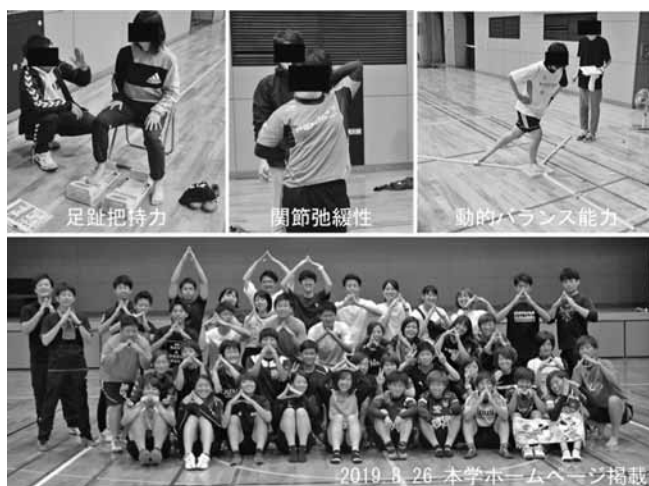
図 1. 身体特性調査の実施風景