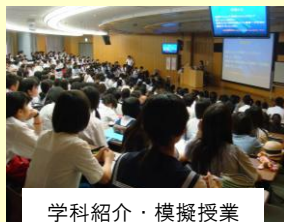
学科紹介・模擬授業