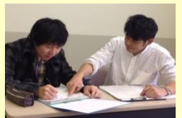
男性教員による実習指導