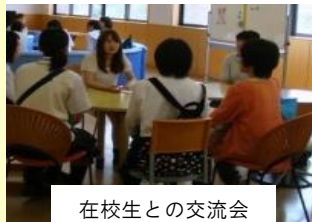
在校生との交流会