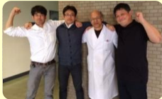
頼もしい男性教員

男子学生は1～2割ですが、ここ数年で増えてきています。クラスの少数派ですが、どの学年も男女分け隔てなく和気あいあいと授業をすすめています。また、男性教員も多く、相談しやすい環境です。男子会に参加すると学年の垣根を越えたネットワークが更に広がります。