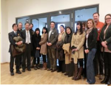
ドイツNRWカトリック大学を訪問

希望する学生には提携校（ドイツNRWカトリック大学等）での研修が可能です。留学生との交流する機会も設けています。