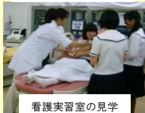
看護実習室の見学