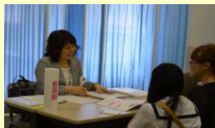
看護学科教員による個別相談